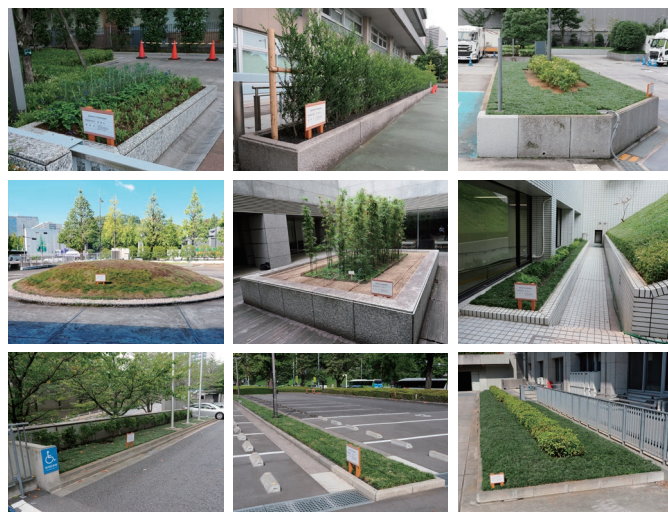
霞が関の中央官庁で施工された花壇等

また、国が8月26日に公表した「福島県内除去土壌等の県外最終処分の実現に向けた復興再生利用等の推進に関するロードマップ」では、復興再生利用の推進に関して、首相官邸、中央官庁で得られた知見を活用し、霞が関の中央官庁以