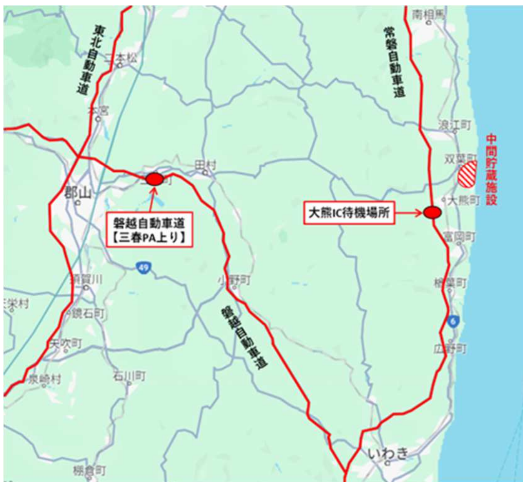
PA（休憩施設）等位置図