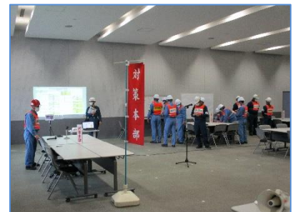
総合防災訓練 対策本部