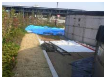
オーバーフローしたNo.4仮設タンクと芝生側