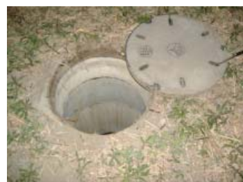
放流口直近の雨水ます③