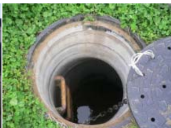
敷地内最終雨水ます②