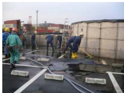
アスファルト面清掃作業