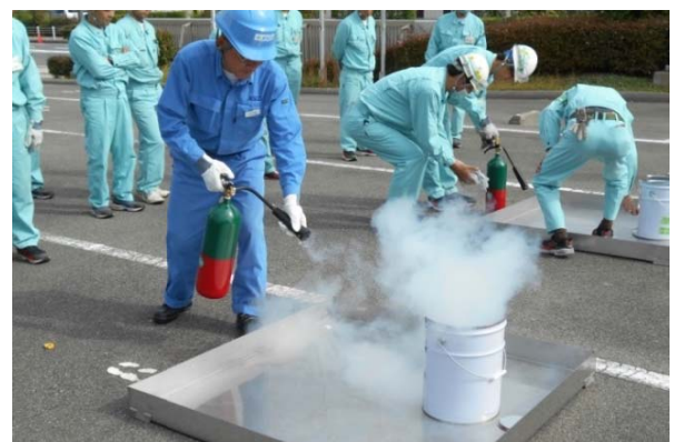
二酸化炭素消火器噴射訓練