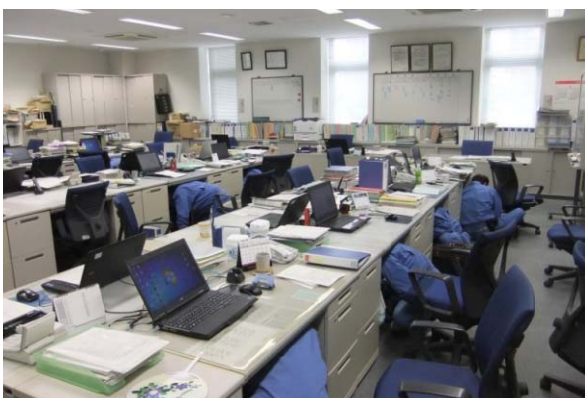
揺れが収まるまで各人が安全を確保

緊急地震速報の放送を確認し、揺れが収まるまで各人が安全を確保した後、設備が安全に停止していることの確認や設備からの PCB 油などの漏洩がないか等の異常チェックを行い、各人が決められた役割に沿って行動する訓練を行いました。この訓練は、万が一の災害に備えて事業所員が的確に行動できるよう毎年行っています。