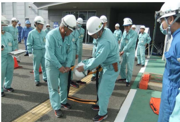
担架組立・搬送訓練

消防訓練は毎年春と秋に実施しています。昨年11月12日には放水訓練、担架組立・搬送訓練、簡易テント組立訓練、二酸化炭素消火器噴射訓練という体験を重視した実技訓練を行いました。緊急事態はいつ発生するか分かりませんので、当事業所員が適切かつ速やかな行動をとることができるよう定期的に訓練を実施しています。