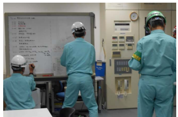
指揮本部の活動状況