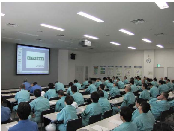
高圧ガス保安教育

4月の安全教育は高圧ガスに関する保安教育を行いました。高圧ガス保安法の説明、可燃性ガス・不燃性ガスの種類や用途、ボンベのガス名表示や色別などについて学びました。ガス濃度が上昇すると酸素欠乏が危惧されるため、酸素濃度と酸素欠乏症状の関係・酸素欠乏事故の特徴などの講義を受けました。5月は毎年実施しているJESCOのISO14001の認証取得の経過や認証取得の効果などに関する教育を行いました。