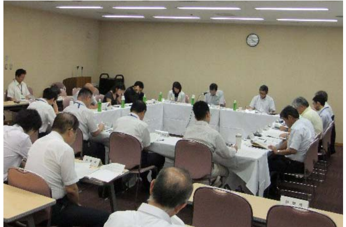
事業監視会議の様子

各委員からは、貴重なご意見を頂き、今後のPCB廃棄物処理事業に反映させてまいります。