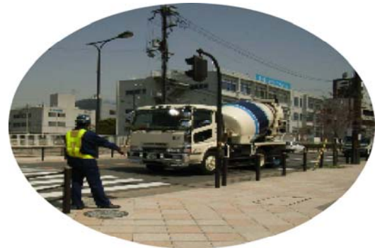
交通誘導員の配備状況（安治川口駅周辺）

工事車両は原則として高速道路を走行します。但し、一部コンクリートミキサー車に限り、安治川沿いルートを走行しますが、決められたルートを確認して走行するよう安治川口駅及びUSJ周辺に交通誘導員を配備し、工事車両が適切に通行しているかを確認すると共に、周辺の安全確保に努めています。