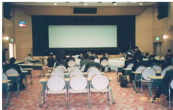
事業監視委員会会議風景

当日は、大阪市から大阪市PCB廃棄物処理計画、処理に係わる生活環境影響調査の検討結果について説明があり、次いで当社から、処理施設の建設状況等について説明を行いました。