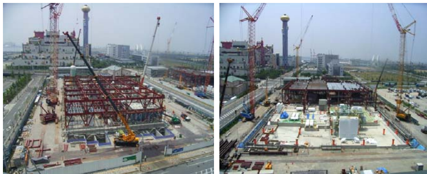
6月21日現在の建設状況（写真左：東区画、右：西区画）

現在は、東区画に2台、西区画に3台、大型クレーンを配置し、来年3月からの試運転に向け、安全確保に努め建設工事を進めています。