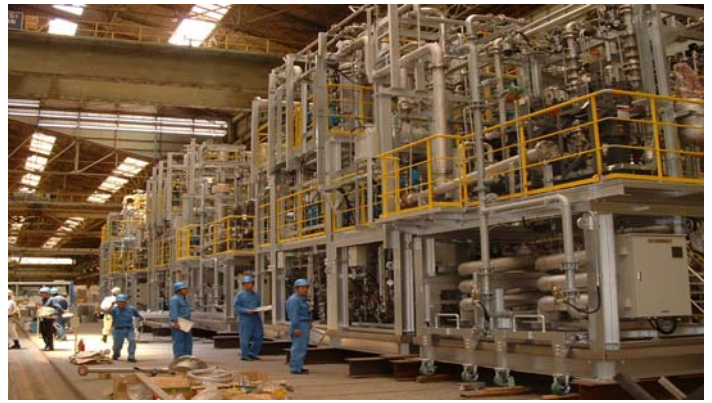
真空加熱分離装置検査状況

品質管理計画に基づき、機器性能を確認するため、製作段階でメーカーの工場へ出向き、機器の製品検査を実施しています。5月20日、三井造船(株)玉野事業所で真空加熱分離装置の製品検査を当社立会いのもと実施しました。なおこの装置は、PCBの浸み込んだ紙、木及びこれらを含んだ部材等を密閉・真空下で加熱し、PCBを分離回収する装置です。