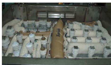
漏れ防止型金属容器の内部